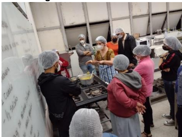
Figura 3 – Evento Virada ODS I